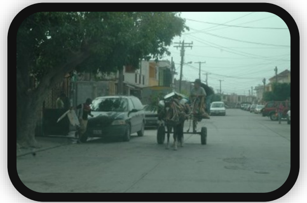
Carretoneros de Matamoras