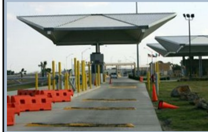
Puente de Donna