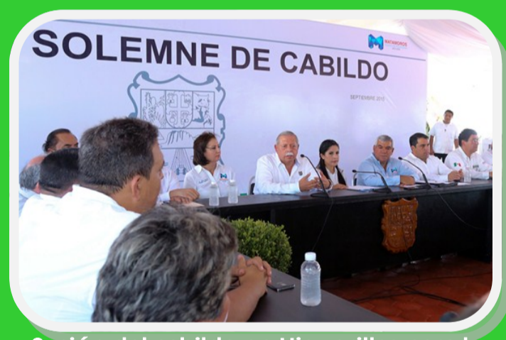
Sesión del cabildo en Higuierillas para la aprobación del PPDU