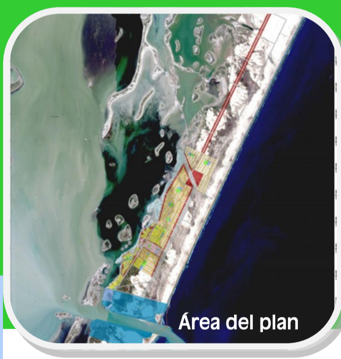
Área del plan