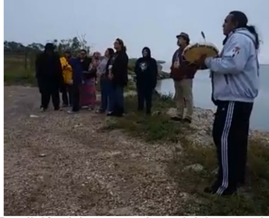
Bendición del agua en el canal del puerto de Brownsville (en primer término, el jefe tribal)