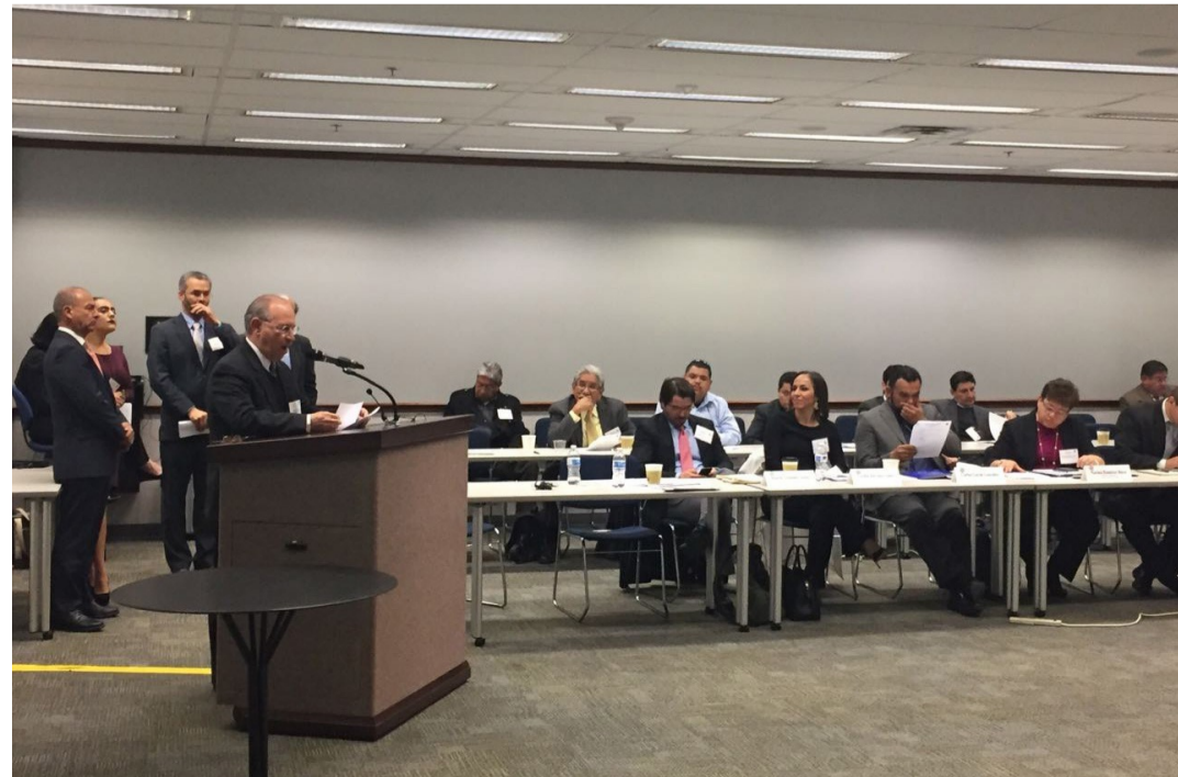
La delegación de Matamoros durante la presentación del proyecto estratégico

Se abordaron los proyectos de expansión y modernización de los puentes internacionales 1 y 2. Asimismo, el Condado de Webb y la Ciudad de Laredo, Tx continúan con la intención de construir el puente 5 (South Laredo), el cual, señalan, permitiría mitigar la saturación de los demás puentes. El proyecto está en fase embrionaria, y todavía no se han realizado los estudios de viabilidad ni de impacto ambiental, ni se ha obtenido el Permiso Presidencial de EUA.