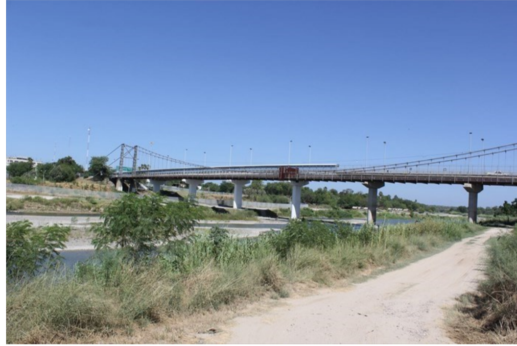
Proyecto del Centro Cultural Binacional, de Matamoros