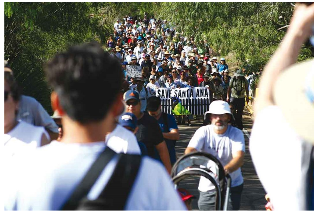
Marcha para protestar contra el muro fronterizo y salvar el refugio Santa Ana (agosto 2017)

como el incremento de tecnología y de personal, lo que fomentaría la economía regional. Hasta fines de septiembre, la resolución había sido aprobada por las comisiones de 12 ciudades: Alamo , Alton , Brownsville , Edinburg , La Joya , McAllen , Mission , Palmview , Pharr , San Juan , Sullivan City y Weslaco , además de la comisión del condado de Hidalgo .