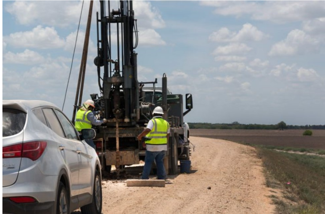
Trabajos para la toma de muestras de suelo donde se construiría el muro, Santa Ana National Wildlife Refuge (julio 2017)