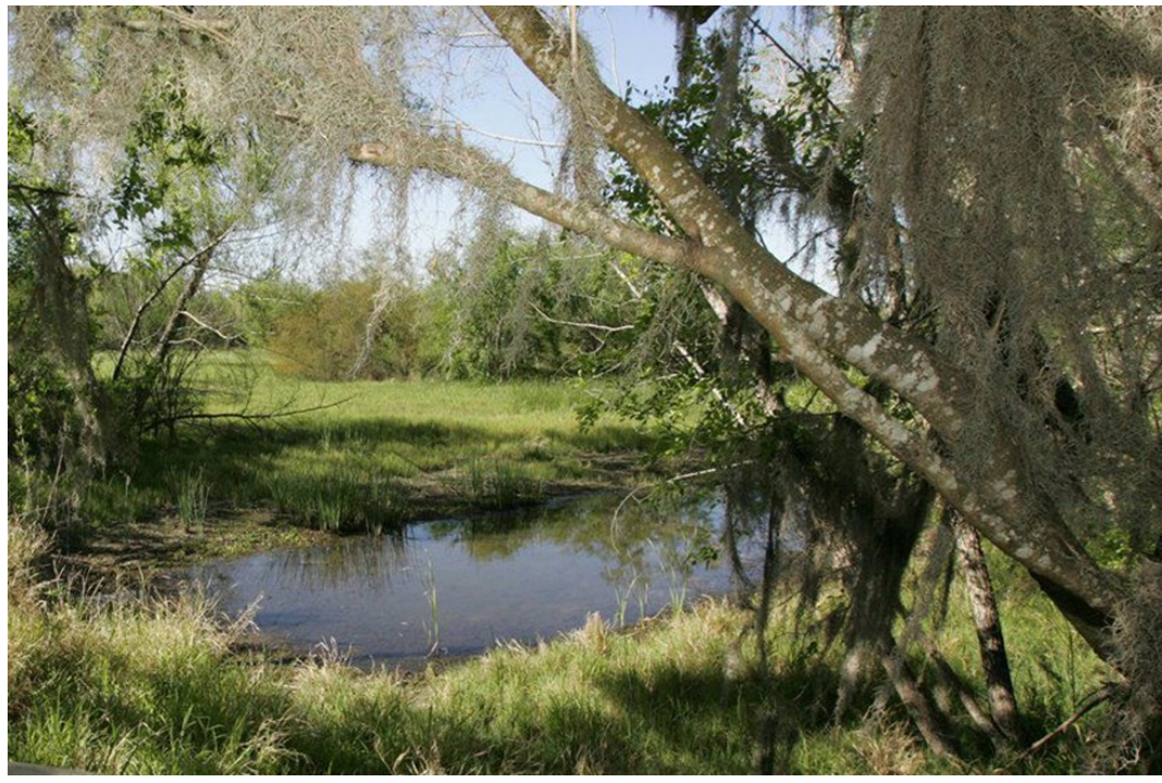
Santa Ana National Wildlife Refuge

Estas informaciones desataron las alarmas tanto de los grupos ambientalistas, preocupados por los posibles daños ambientales, como de distintos grupos comunitarios, religiosos, pro-derechos humanos, etc. contrarios a la construcción del muro. Ya en marzo de 2017 habían rechazado la solicitud de las autoridades del condado para que el DHS lo construyera (ver Newsletter, núm.04/10 ). Una de las primeras acciones llevadas a cabo fue buscar el apoyo de los congresistas demócratas Filemón Vela y Bennie Thompson, miembros del U.S. House Committee on Homeland Security , para que obtuvieran más información de la CBP al respecto.