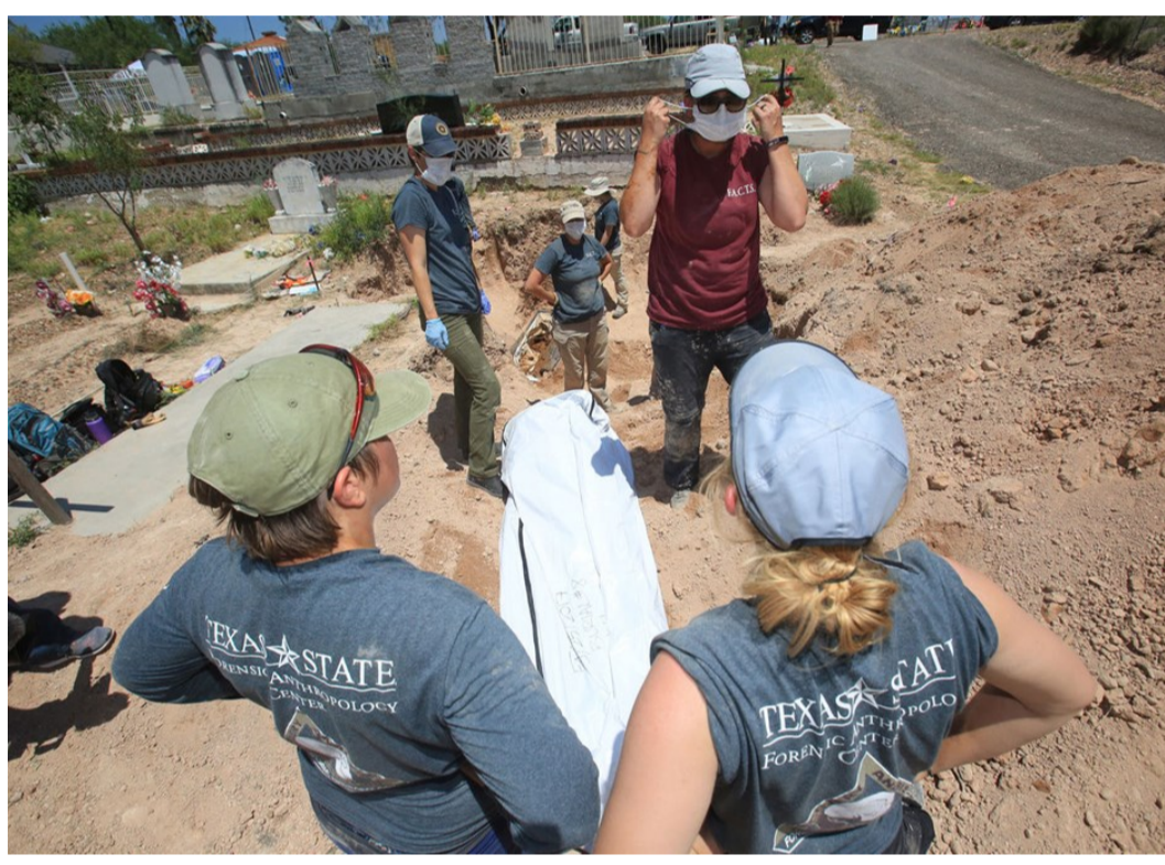
Trabajos de exhumación en el cementerio de Rio Grande City (mayo 2017)

Reflejo de los cambios provocados por el descubrimiento de estas tumbas, en la exhumación del cementerio de Santa Mónica (enero 2018) estuvieron presentes personal de la U.S. Customs and Border Protection , en el marco del "Missing Migrant Program" (MMP, creado a fines de 2017), y de los consulados de El Salvador y Guatemala en McAllen.