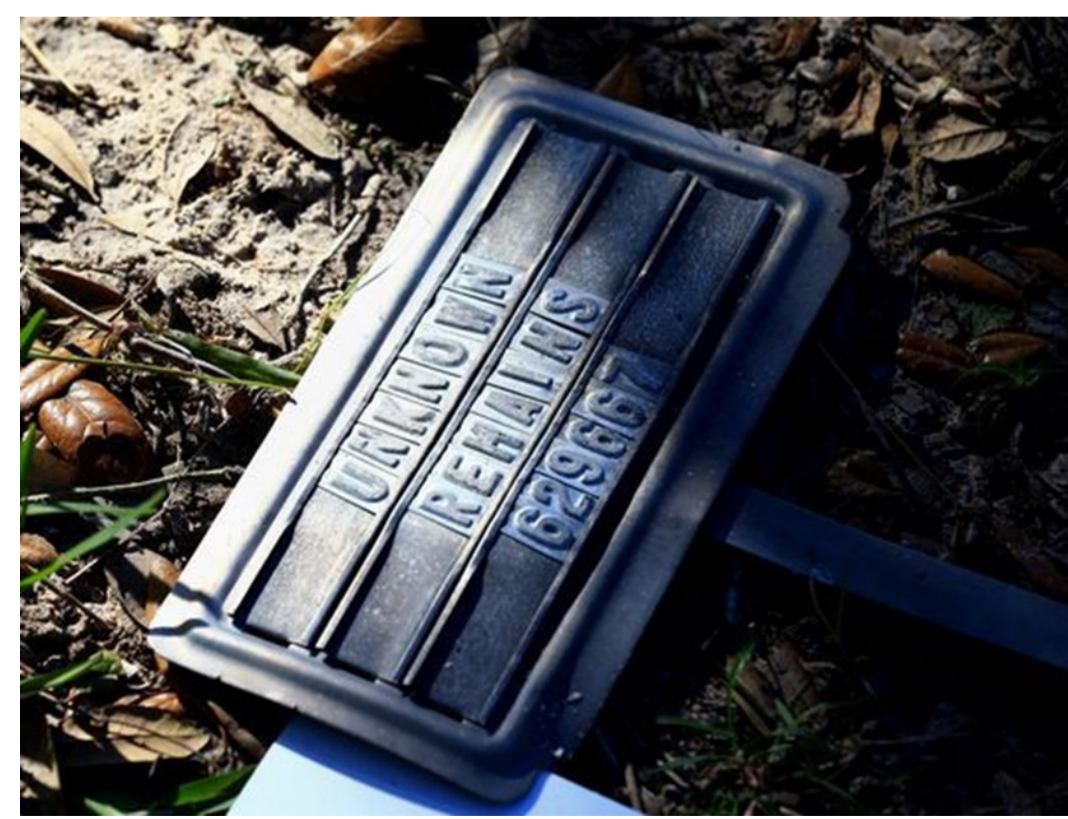
Marcador de una tumba de una persona no-identificada en Falfurrias, condado de Brooks (enero 2017)