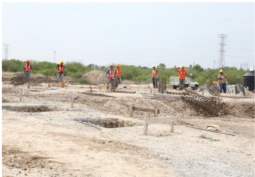
Avance en la construcción del centro de bienestar y paz en Los Guerra (mayo 2018)

No se sabe con exactitud cuántos centros se está construyendo o están proyectados. A partir de la información difundida por los medios de comunicación y el seguimiento en twitter del Gobernador del estado , se han contado hasta 13 centros en proceso de construcción, y 3 más como previstos. Por lo general, se trata de un centro por municipio (aunque en alguno se están construyendo 2, como en Miguel Alemán), a la vez que la mayor parte se localizan en colonias populares y fraccionamientos ubicados en la periferia de la cabecera municipal. De acuerdo a la SEBIEN, los centros están enfocados a la “rehabilitación” de los espacios públicos existentes de la propia secretaría, por lo que la mayoría se está construyendo en predios adyacentes a los “parques de bienestar” (actualmente existen 63 en 25 municipios).