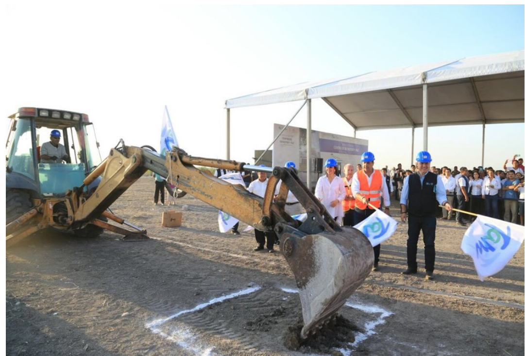
Arranque de la construcción del centro de bienestar y paz de Matamoros por el Gobernador del estado, Francisco Cabeza de Vaca (marzo 2018)