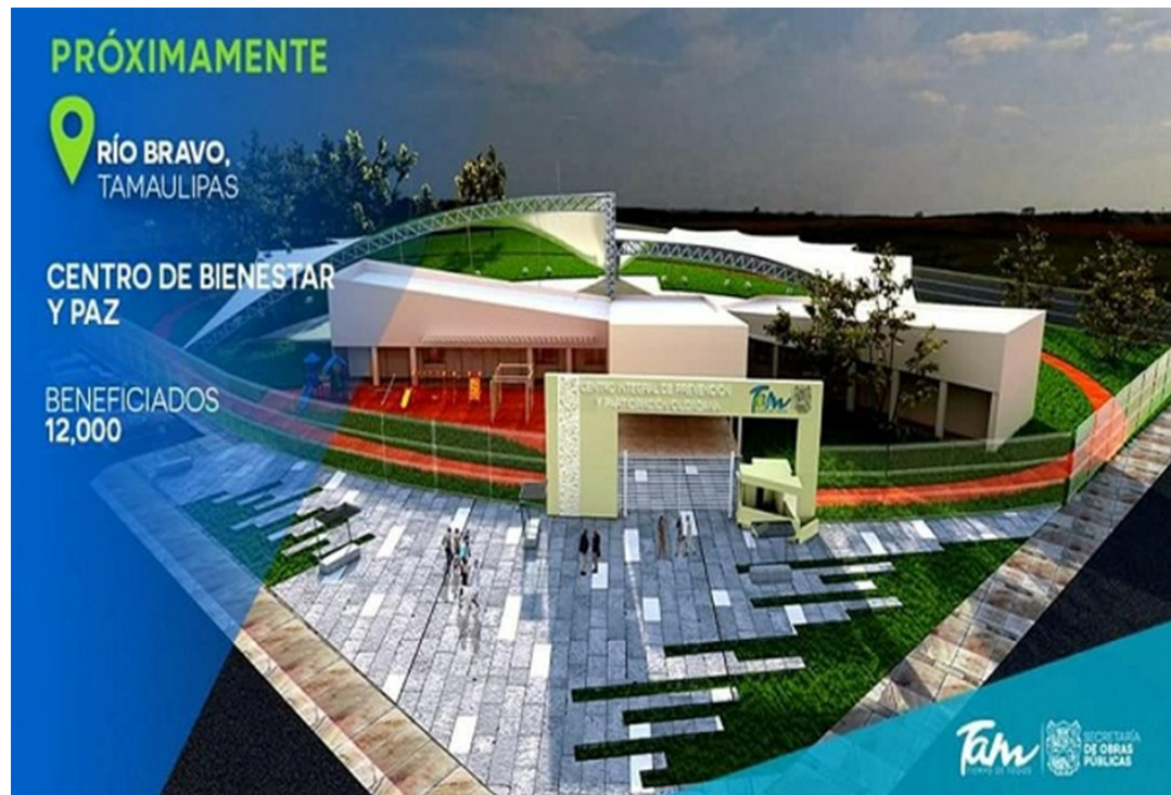
Proyección del centro de bienestar y paz de Cd. Río Bravo

Tampoco se sabe con exactitud cuál es la inversión destinada al programa, aunque al parecer el presupuesto destinado a la construcción de cada centro es de unos 22 millones de pesos, lo que supondría una inversión total de entre 286 y 352 millones de pesos.