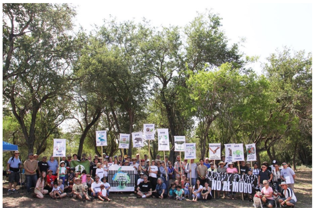
Activistas contra el muro en el parque estatal Bentsen-Rio Grande Valley (mayo 2018)