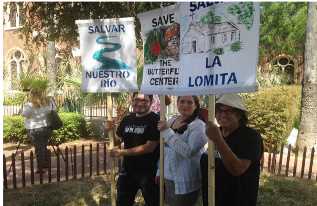
Protesta contra la aprobación de fondos para la construcción del muro (marzo 2018)

mental Awareness Club y Lower Rio Grande Valley Sierra Club , se manifestaron en el acceso al parque para mostrar su rechazo.