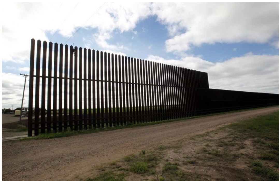
Sección del muro fronterizo en Rio Grande Valley

En abril 2018 la CBP anunció que pronto contactaría a los propietarios de los terrenos programados para la construcción del muro, para realizar los estudios iniciales, conocidos como “Rights of Entry for Survey” (ROE-S), y posteriormente comenzar los procesos de adquisición de los terrenos, de impacto ambiental y de diseño de la infraestructura fronteriza. Finalmente a principios de mayo la CBP contactó a varios propietarios, entre los cuales se encuentran las ciudades de Donna y Mission y la Diócesis de Brownsville . Hasta mediados de mes, únicamente Donna había aprobado la solicitud de la CBP. Paralelamente, también en mayo, el DHS publicó un primer concurso MATOC para la construcción del muro en esta región.