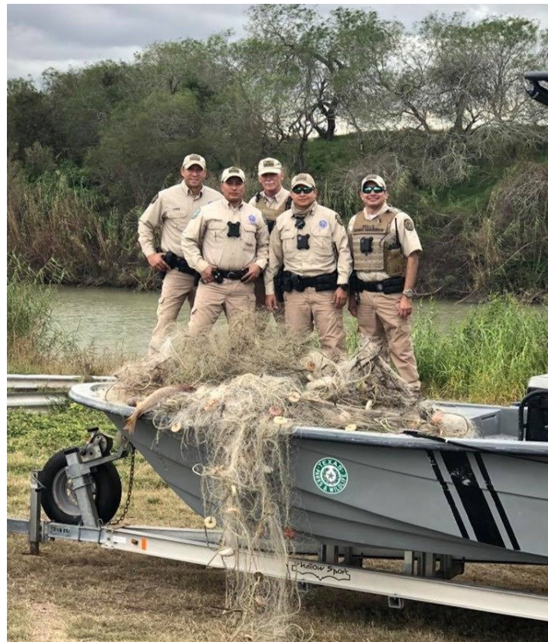
Una patrulla de Texas Game Wardens con redes confiscadas, cerca de Brownsville (enero 2019)

enero de 2019 realizaron otros 3 recorridos (los días 11, 13 –este nocturno– y 15) durante los cuales se localizaron 33 redes de enmalle, que en total sumaban una longitud de entre 7,000 y 10,000 pies (2,134-3,048 m). En ambas operaciones se cortaron las redes por la mitad (coincidiendo con el límite fronterizo) y se retiró la parte que se encontraba en aguas estadounidenses; posteriormente se destruyeron. En cuanto a la fauna atrapada en las redes, los ejemplares vivos fueron liberados, mientras que los muertos se retiraron junto con la red.