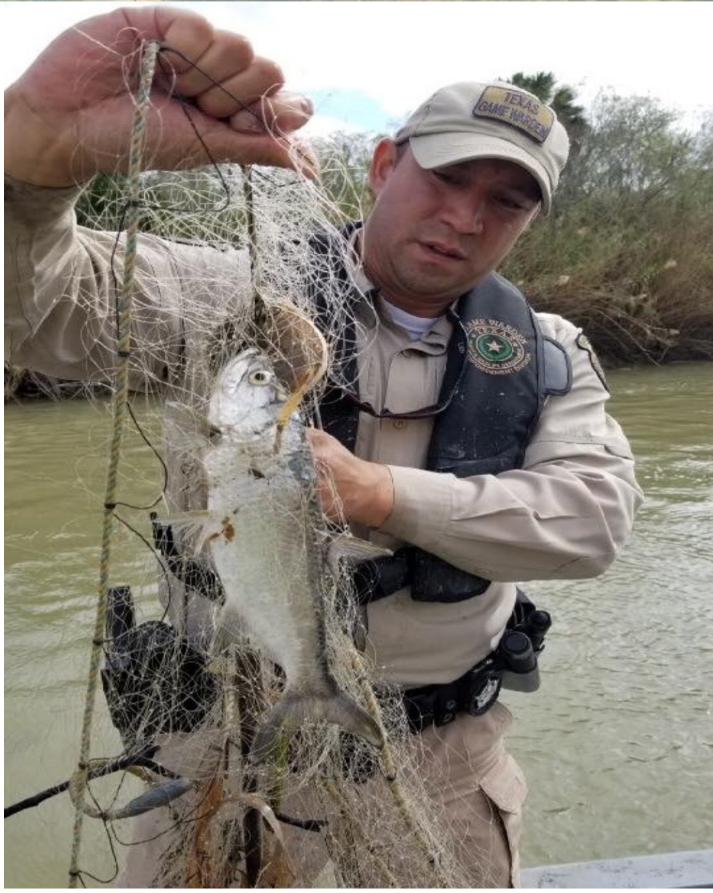
Extracción de una red de enmalle (enero 2019)

En el golfo de México y en los embalses internacionales de Falcón y Amistad también operan ilegalmente barcos pesqueros mexicanos con redes de enmalle y pesca con palangre (en inglés, longlining ), ambas artes prohibidas en aguas de Texas. En aguas del golfo de la zona económica exclusiva de Estados Unidos ( ver Newsletter, núm.4/16 ), la U.S. Coast Guard estima que anualmente se producen más de 1,100 entradas ilegales de barcos de pesca, procedentes de puertos de México. La pesca ilegal es vista como un problema por distintas agencias (Texas Game Wardens, U.S. Coast Guard, U.S. Customs & Border Protection y el Department of Homeland Security ), por lo que comparten recursos para patrullar estas aguas.