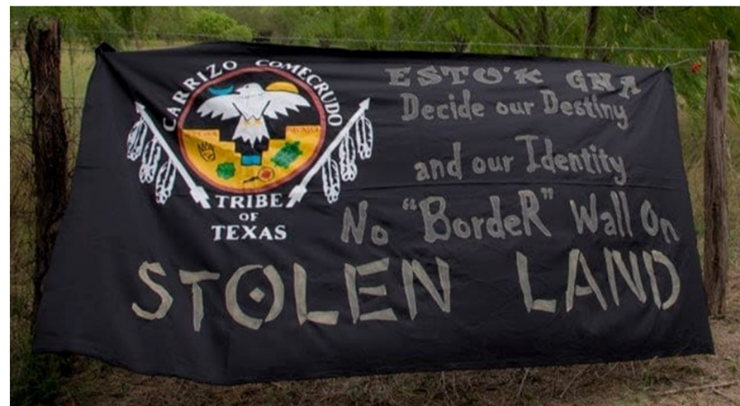
Cartel de protesta en Yalui village