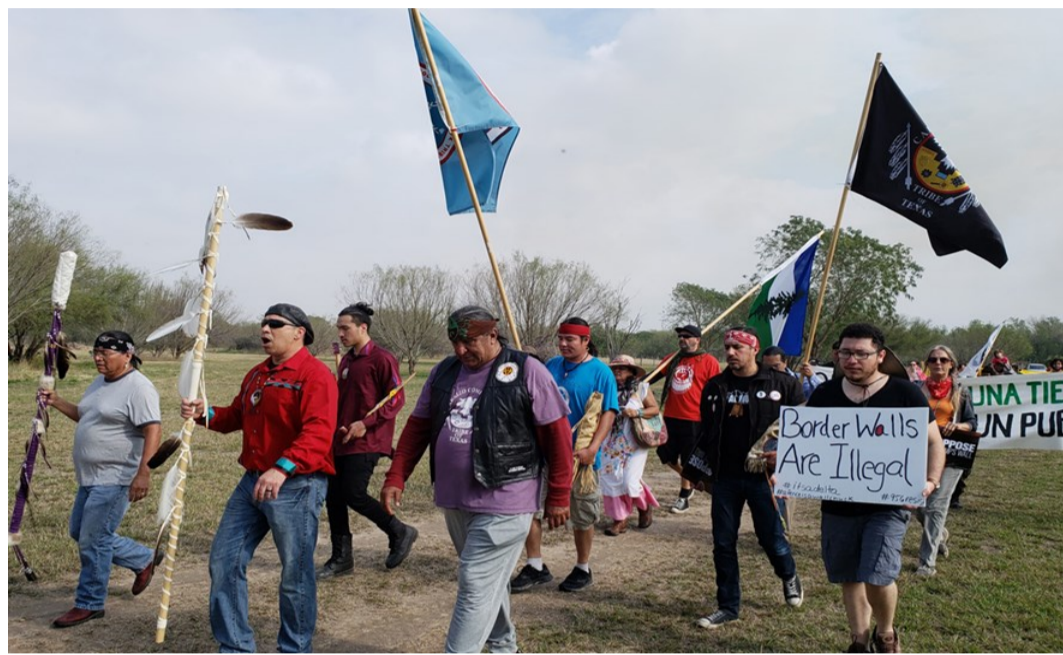
Marcha de protesta en National Butterfly Center (febrero 2019)

pietaria legítima, y que se opone a la presencia de los activistas. Considera que el cementerio y el terreno donde está el campamento está siendo destruido y ensuciado por ellos, en lugar de mantenerlo a salvo.