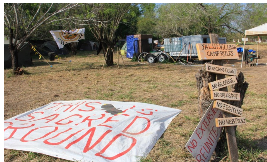
Yalui village; y el cementerio de Eli Jackson (al fondo a la derecha) (marzo 2019)