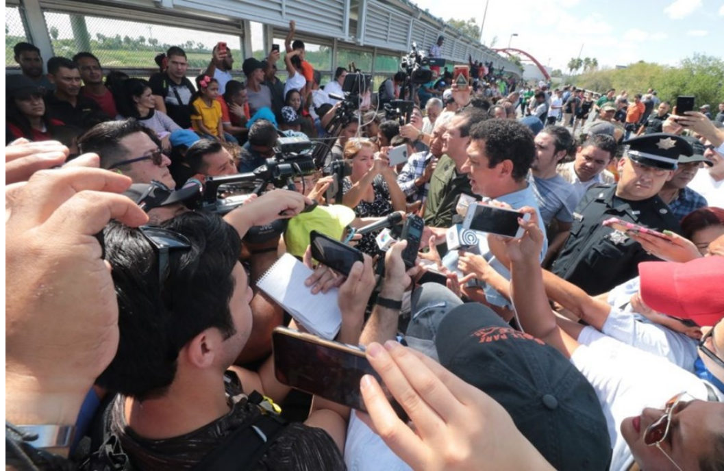
Diálogo entre migrantes y autoridades mexicanas en el puente Nuevo

Por su parte, los actores políticos y económicos de Matamoros rechazaron completamente la acción de protesta de los migrantes. En esta dirección, por ejemplo, la Confederación Patronal de la República Mexicana (Coparmex) en Matamoros calificó de “atentado sobre la economía de la ciudad” el bloqueo del puente por parte de los migrantes (pero no el cierre por parte de la CBP) y reclamaba una actuación rápida para desalojarlos.