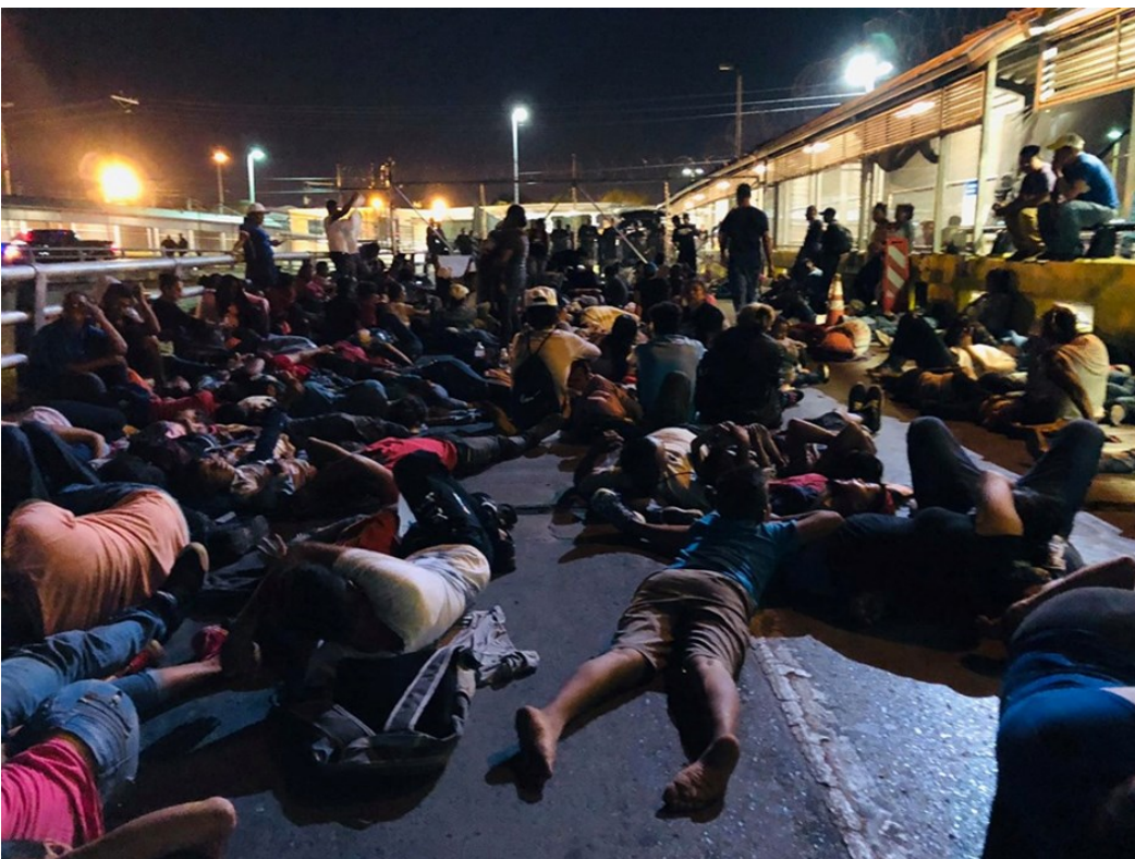
Ocupación del puente Nuevo por los solicitantes de asilo

Como forma de protesta pacífica, hacia la 01.00am un grupo de unos 300 solicitantes de asilo (hombres, mujeres y menores) establecidos en el campamento cercano al puente (ver Newsletter, núm.6/22 ) se trasladó hasta la mitad del puente para ocuparlo y realizar una sentada; durante la sentada, se entonaron cantos y oraciones. El objetivo era presionar al gobierno estadounidense para que se agilizaran los trámites de solicitud de asilo, cuyo proceso consideran muy lento, así como para pedir a las autoridades mexicanas unas mejores condiciones de vida durante su estancia obligada en Matamoros.