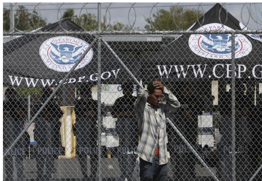
Puerta cerrada y custodiada por agentes de la CBP

En 2018, en previsión del intento de entrada masiva de migrantes, el Department of Homeland Security (DHS) apremió a los propietarios de los puentes internacionales de Texas la aplicación de medidas para incrementar la seguridad. Las medidas de port hardening consisten básicamente en la instalación de 1) puertas rejadas en mitad de los puentes, sobre la línea fronteriza, tanto en los carriles peatonales como en los vehiculares, para poder cerrar el acceso; y 2) alambre de espino en el perímetro del puente y/o de los carriles.