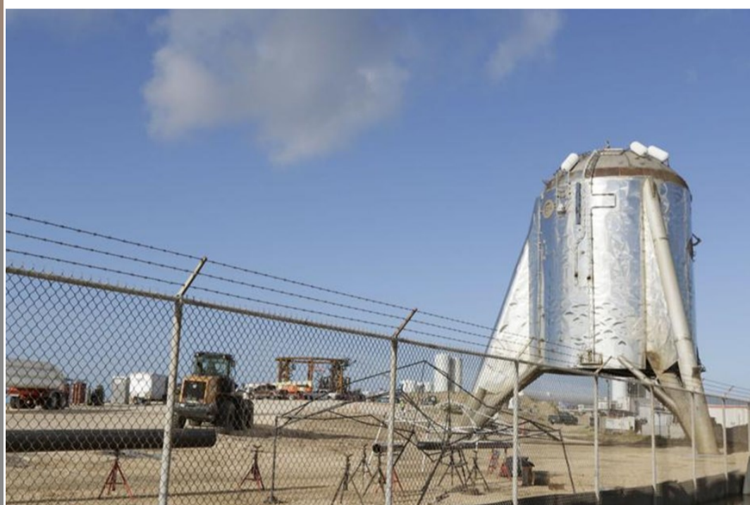
Un prototipo de nave en el recinto de Space X en Boca Chica (octubre 2019)

E n enero de 2019 concluyó la construcción de la plataforma de lanzamiento de Space Exploration Technologies Corporation ( SpaceX ) en Boca Chica, en el condado de Cameron (ver Newsletter, núm.1/41 y núm.6/09 ). Con una gran expectativa, en abril Space X llevó a cabo la primera prueba de un prototipo de nave (Starship hopper), y hasta octubre se han realizado unas 10. Durante las pruebas se aplica un perímetro de seguridad, tanto terrestre como aéreo, dentro del cual se imponen varias restricciones. A medida que han aumentado el alcance de las pruebas, también han aumentado los impactos sociales (en Boca Chica Village) y ambientales.