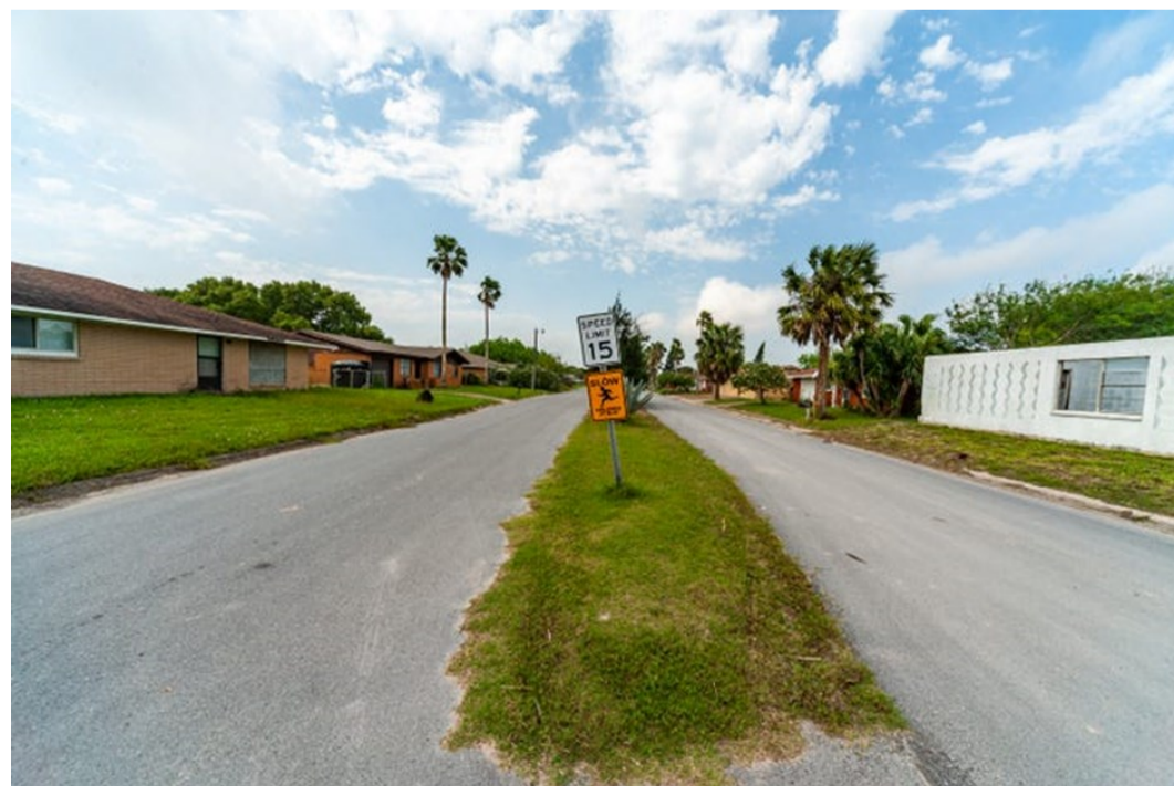
Boca Chica Village

Inicialmente, en 2014, SpaceX no preveía una “interrupción significativa” para los habitantes de Boca Chica Village, una localidad de poco más de 20 personas, la mayoría jubiladas, situada a 1.5 millas (2.4 km) de la plataforma de lanzamiento. Sin embargo, a medida que han avanzado las pruebas la empresa se ha dado cuenta que las afectaciones son cada vez más difíciles de minimizar. En esta dirección, para la prueba del 27 de agosto –en la cual la nave se elevó hasta los 150 m– se recomendó la evacuación de los habitantes. El Juez del condado, a petición de la FAA, les advirtió que los vidrios de las ventanas podían romperse a causa de la onda expansiva en caso que la nave explotara; como máximo, podían permanecer en su propiedad, pero fuera de la casa.