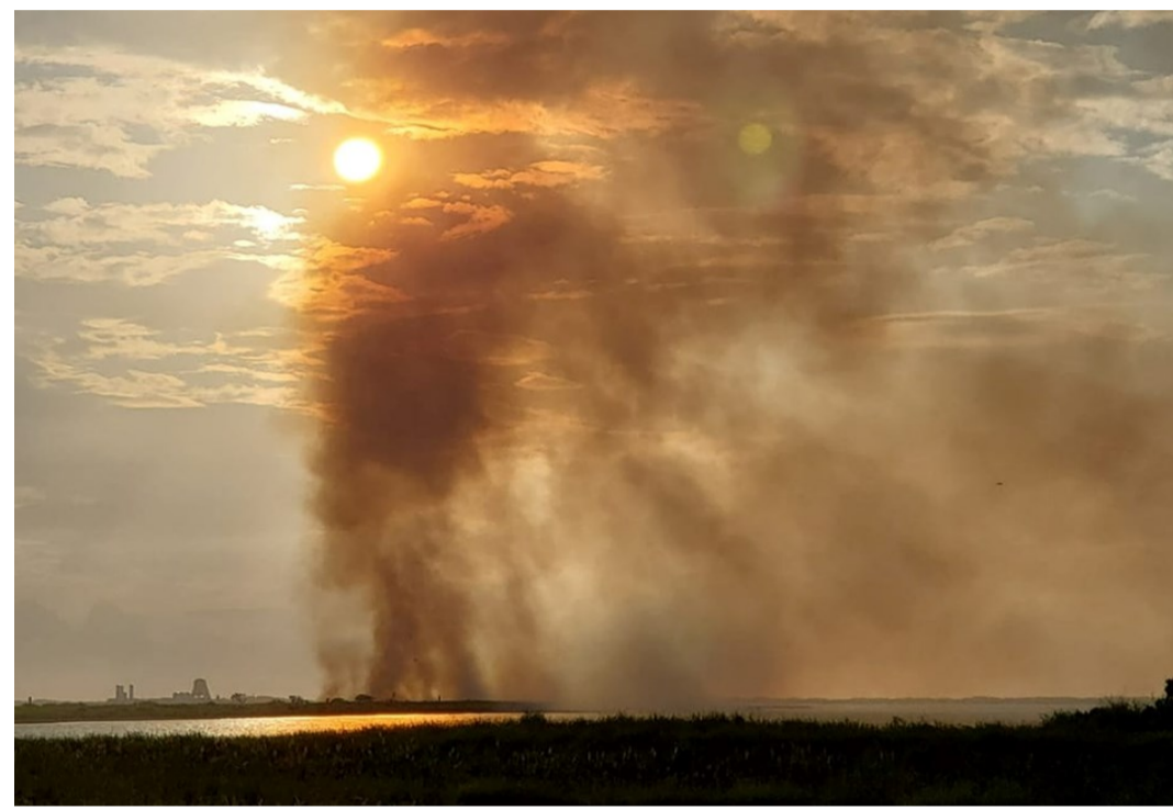
Incendio en Las Palomas Wildlife Management Refuge (julio 2019)

una prueba provocó un incendio en la adyacente área natural protegida de Las Palomas Wildlife Management Refuge . El incendio afectó una superficie de 100 acres (40.5 ha), y los bomberos tardaron unas 15 horas en poder extinguirlo.