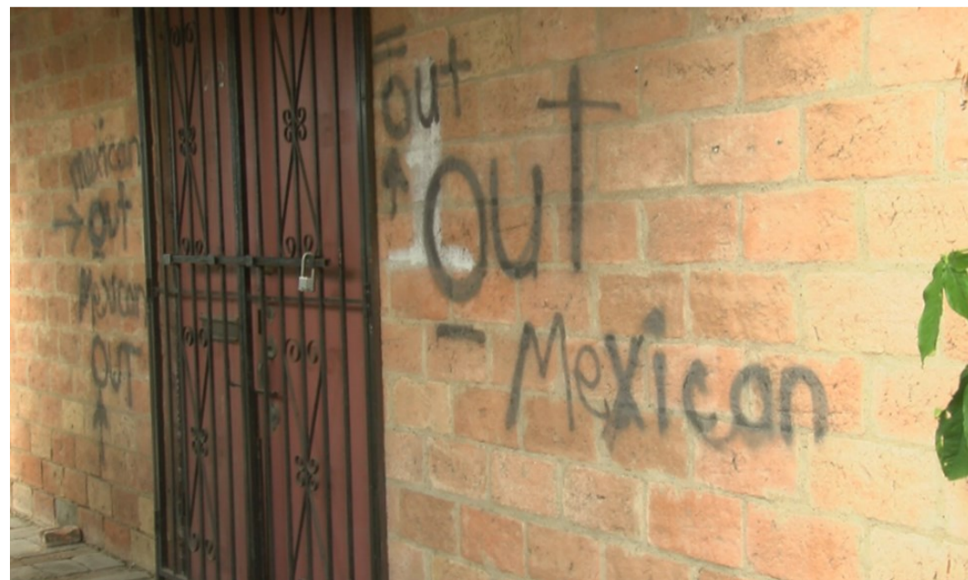
Exterior del templo unitarista universalista All Souls de Brownsville (febrero 2020)