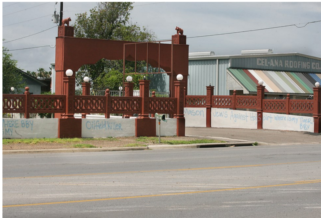
Exterior del centro hinduista Shri Nanak (mayo 2020)

Por último, en el Centro Shri Nanak se grafitearon –con las mismas referencias– la puerta exterior y el muro perimetral; a diferencia de los demás, no se vandalizó el templo propiamente dicho, Shiv Shakti (que se ubica dentro del Centro, que a la