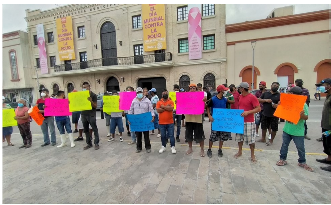
Protestas de los pescadores de Las Higuerillas en la plaza Principal de Matamoros (octubre de 2021)

Como las obras se detuvieron poco después, los pescadores dejaron la protesta. Pero al reanudarse en octubre, se manifestaron por segunda vez, en esta ocasión en la plaza Principal de Matamoros, frente al Palacio municipal. Unas decenas de pobladores, junto con el delegado municipal de Las Higuerillas, insistían en que fueran escuchados por las autoridades municipales y estatales, y que se paralizaran las obras o, en su defecto, que no se les negara a ellos ni a los turistas el acceso libre a la playa ni a las escolleras. Llevaban consigo cartulinas con distintas leyendas: “La playa es del pueblo, no de la API”, “Quién te da el derecho de quitar nuestros ingresos”, “La playa no puede ser privatizada”, entre otras. Finalmente, el Secretario municipal accedió a reunirse con ellos, quienes presentaron sus quejas y el Secretario se comprometió a transmitir las al alcalde.