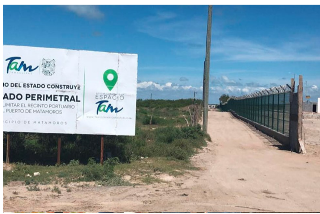
Construcción de la barda perimetral del puerto de Matamoros (junio 2019)