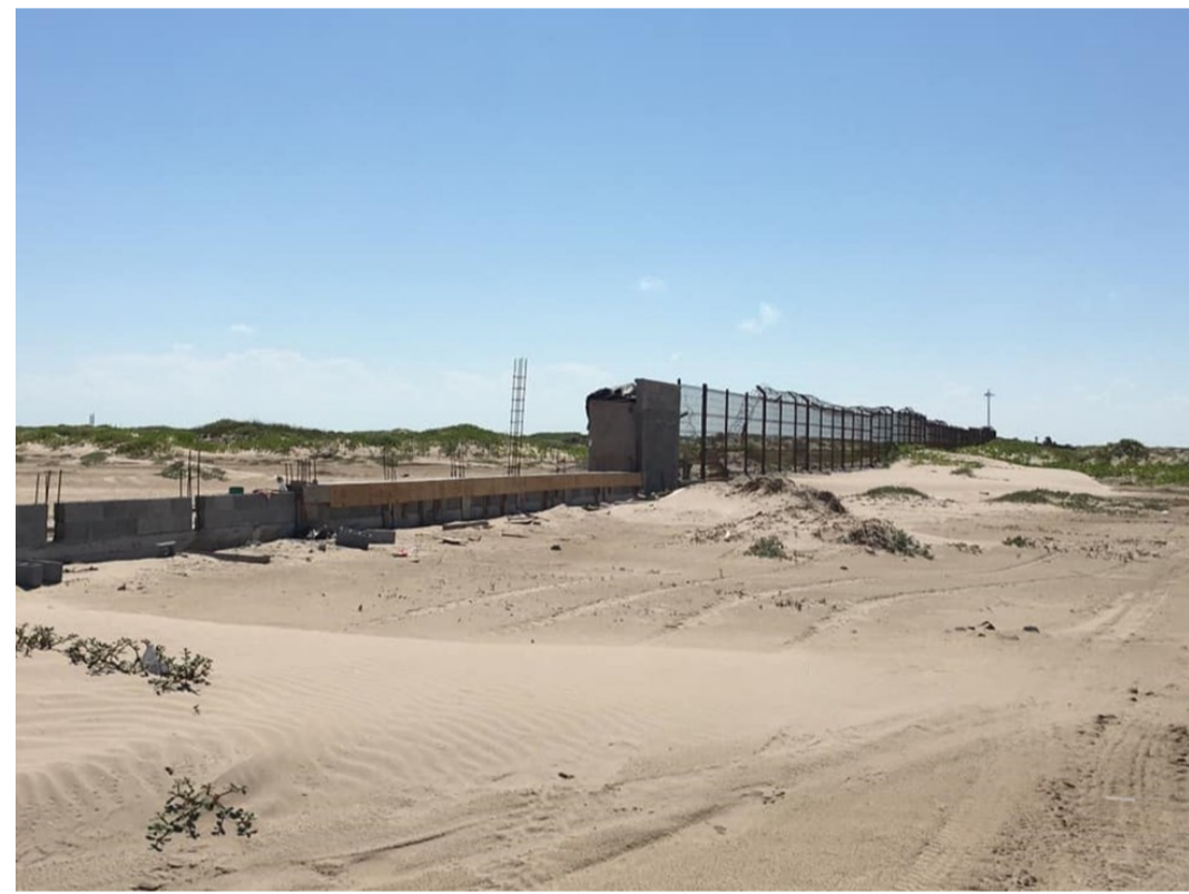
Barda perimetral del puerto de Matamoros en construcción (agosto 2021)

una barda perimetral para demarcar el recinto del puerto e impedir el acceso libre a las personas ajenas. En primer lugar, en 2018 y 2019 se construyó la barda que separa el recinto del fraccionamiento Los Pescadores (ver Newsletter, núm.7/04 ). Esa barda ya fue polémica, ya que impedía a los pobladores el acceso libre por tierra al faro y a los embarcaderos. Más recientemente, en julio de 2021 se continuó la construcción con una barda que se extiende hacia la playa de El Mezquital (se especula que hasta unos metros mar adentro), que impedirá el acceso libre a las escolleras. Las obras aún no se han concluido; según los pescadores, se detuvieron en agosto y se reanudaron en octubre.