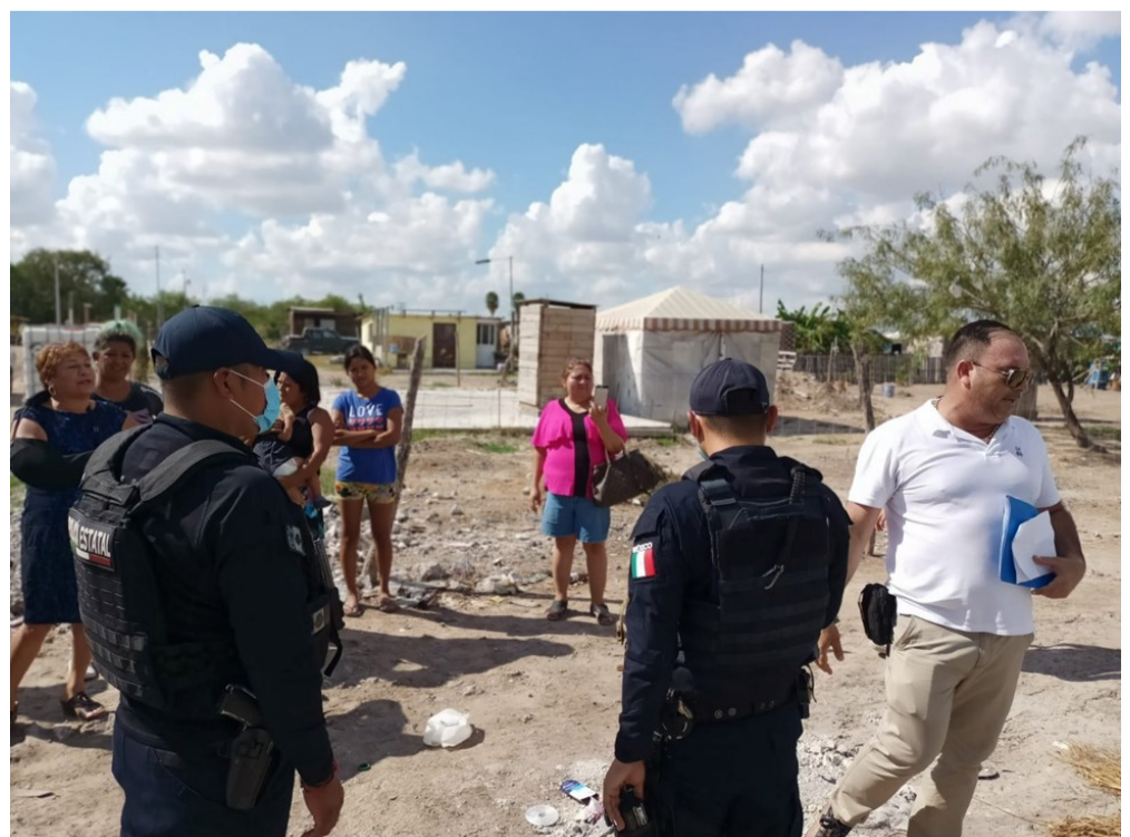
Discusión entre familias invasoras, el apoderado legal de la propiedad del predio y la Policía Estatal en la invasión de la Copa de los Ángeles (noviembre 2021)

Poco después, y ya con el predio limpio, unas 20 familias invadieron una parte del predio para destinarlo a vivienda. Según relataron ellos mismos, no querían usurparlo, sino que esperaban forzar al propietario a venderles los lotes ocupados. Inmediatamente a su llegada, las familias lo-tearon y levantaron bardas con troncos, y en los meses siguientes construyeron casas con madera y otros materiales, además de extender la instalación eléctrica. El apoderado legal de la propiedad se presentó al lugar varias veces para exigirles que se fueran, a la vez que exigía también al gobierno municipal que interviniera para desalojarlos.