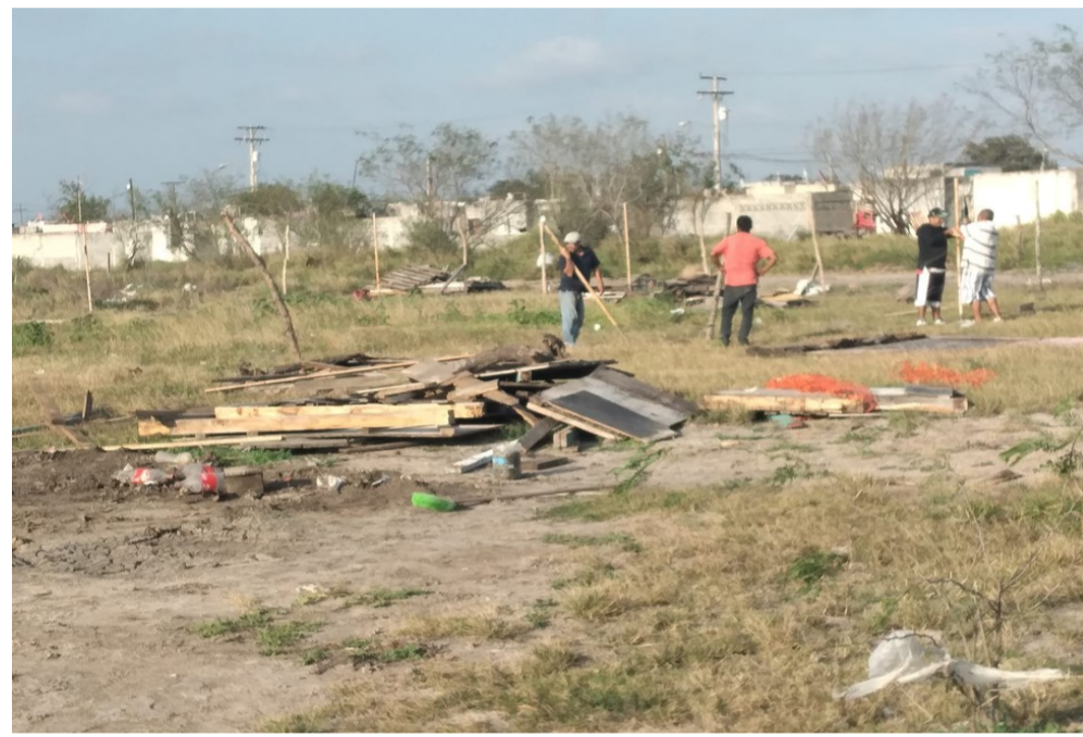
Lotificación y construcción de bardas en la invasión en Platerías (febrero 2022)

cambio de apoyarles en algunas acciones de carácter político en la cercana campaña electoral. Al iniciar la invasión, las familias limpiaron el predio, donde todavía se acumulaba basura, y posteriormente lotearon y construyeron, con madera y troncos, bardas y la estructura básica de lo que tendría que ser las viviendas. Poco después se personó el apoderado legal, acompañado de una cuadrilla, que se negó a negociar nada con los invasores e hizo derribar las construcciones.