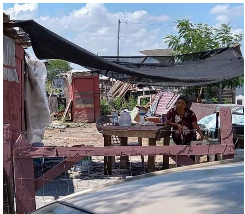
Viviendas en la invasión de la Copa de los Ángeles (agosto 2021)

quinaria. Al poco tiempo se presentó al lugar el representante del propietario, a quien le exigieron se les reembolsara lo invertido para la maquinaria y el traslado, y a lo que el representante se negó. La tensión entre ambos fue escalando hasta que, en octubre de 2020, el representante hizo construir una barda perimetral de bloc, que impedía a los vecinos acortar distancias cruzando por el predio. Contrariados, los vecinos derribaron la barda y ocuparon el lugar hasta que finalmente el apoderado legal aceptó negociar el reembolso.